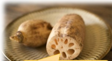
名産品は門真レンコン