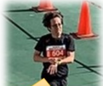
41' 39" / 10km