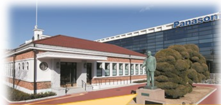
幸之助翁が蓮沼を買って創業したらしいです