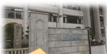
馬車道のある古い学校