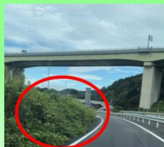
豊田市松平志賀町