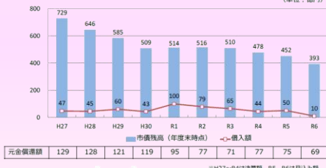
【市債残高(年度末時点)と借入額の推移】 (単位: 億円)