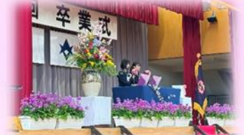
こども園、小中学校卒業式